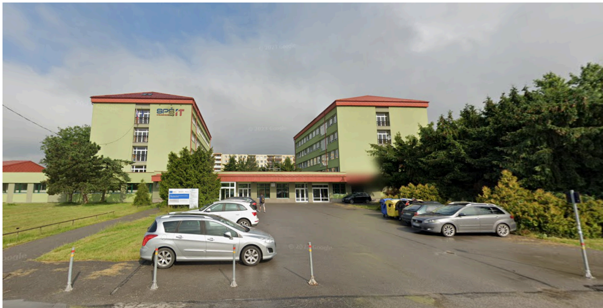
SPŠIT Nábřežná 1325, Kysucké Nové Mesto , miesto ubytovania