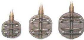
Flat Method Feeder