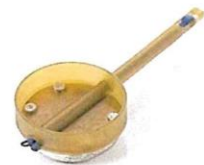
Banjo Feeder Elasticated