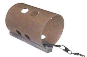
Open End Feeder