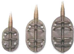
Flat Method Feeder