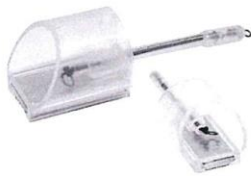
Pellet Feeder Elasticated